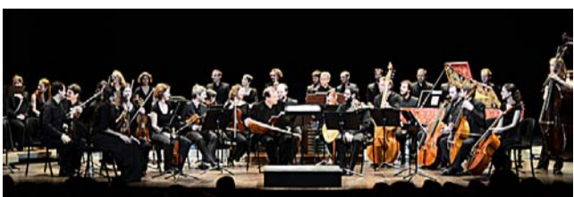
Kveldens konsert ved Oslo Internasjonale Kirkemusikkfestival: Ensemble Pygmalion spiller i Oslo domkirke.

– På en og en halv time vil du høre alt av Bachs beste musikk i hans eget utvalg. ARNE GUTTORMSEN